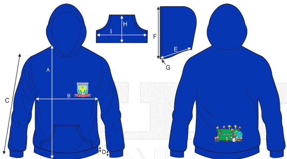
Blusa acabada em cm (variação aceitável de 1cm)